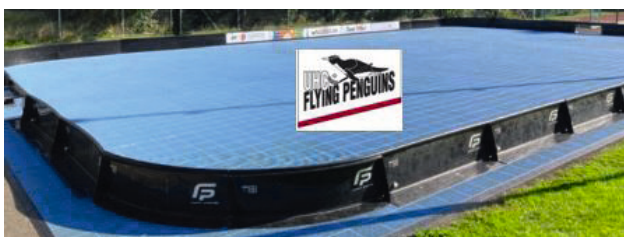
Beispiel eines Streetfloorball Feldes.

Der UHC Flying Penguins Niederwil wurde letztes Jahr 25-jährig. Damit wir den Verein und das Unihockeyspiel noch bekannter machen können, stellen wir der ganzen Bevölkerung, den Schulen beim OZ Thurzelg ein Streetfloorball-Feld zur Verfügung. Wir haben dies vom Dienstag, 7. Mai 2024 bis Donnerstag, 27. Juni 2024 extern gemietet. Beim Streetfloorball wird 3gegen3 ohne Torhüter und ohne Schiedsrichter gespielt. Die Mannschaften einigen sich untereinander.