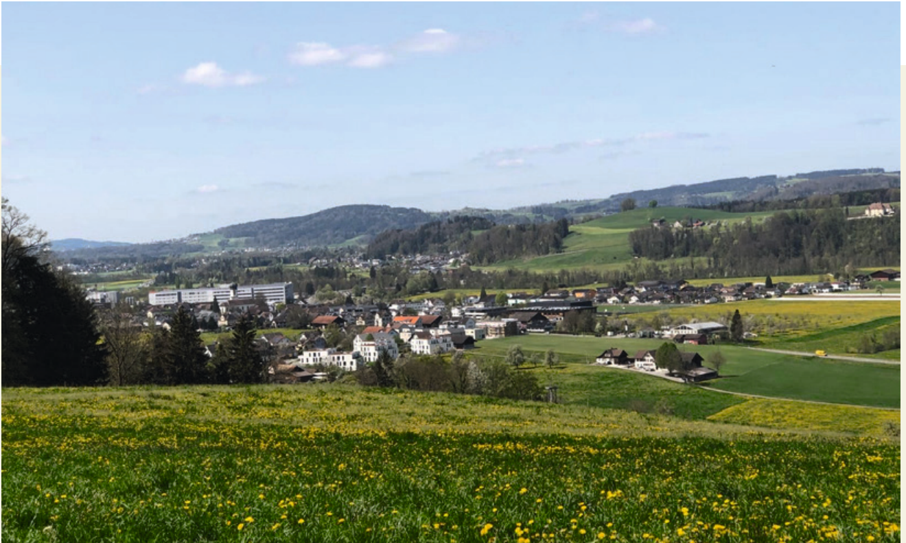
Frühling im Dorf Oberbüren.